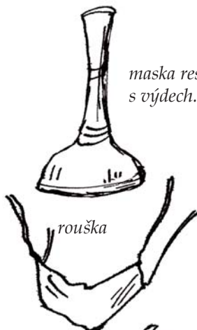
maska resuscitační s výdech. chlopni a filtrem