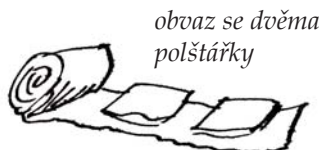
obvaz se dvěma polštářky